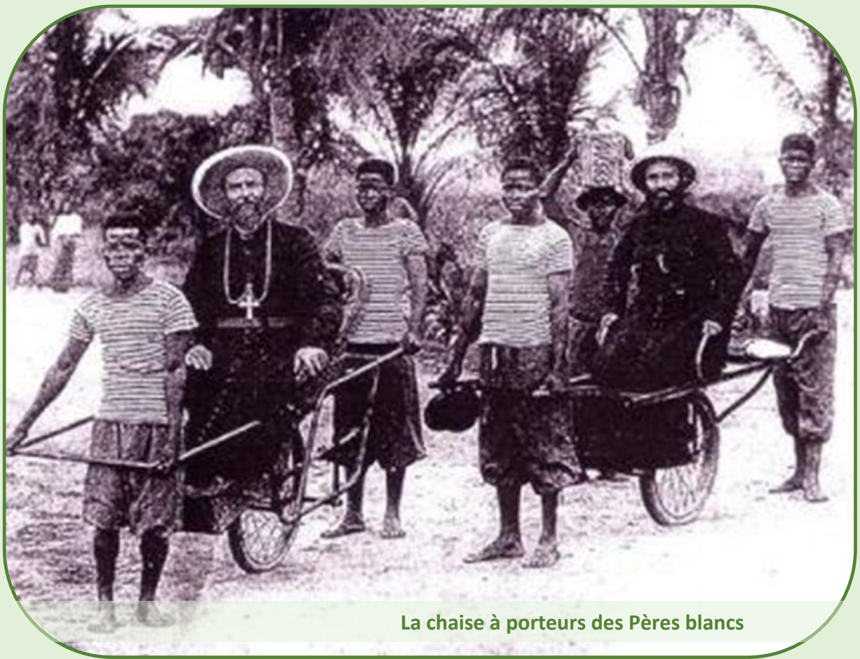
La chaise à porteurs des Pères blancs