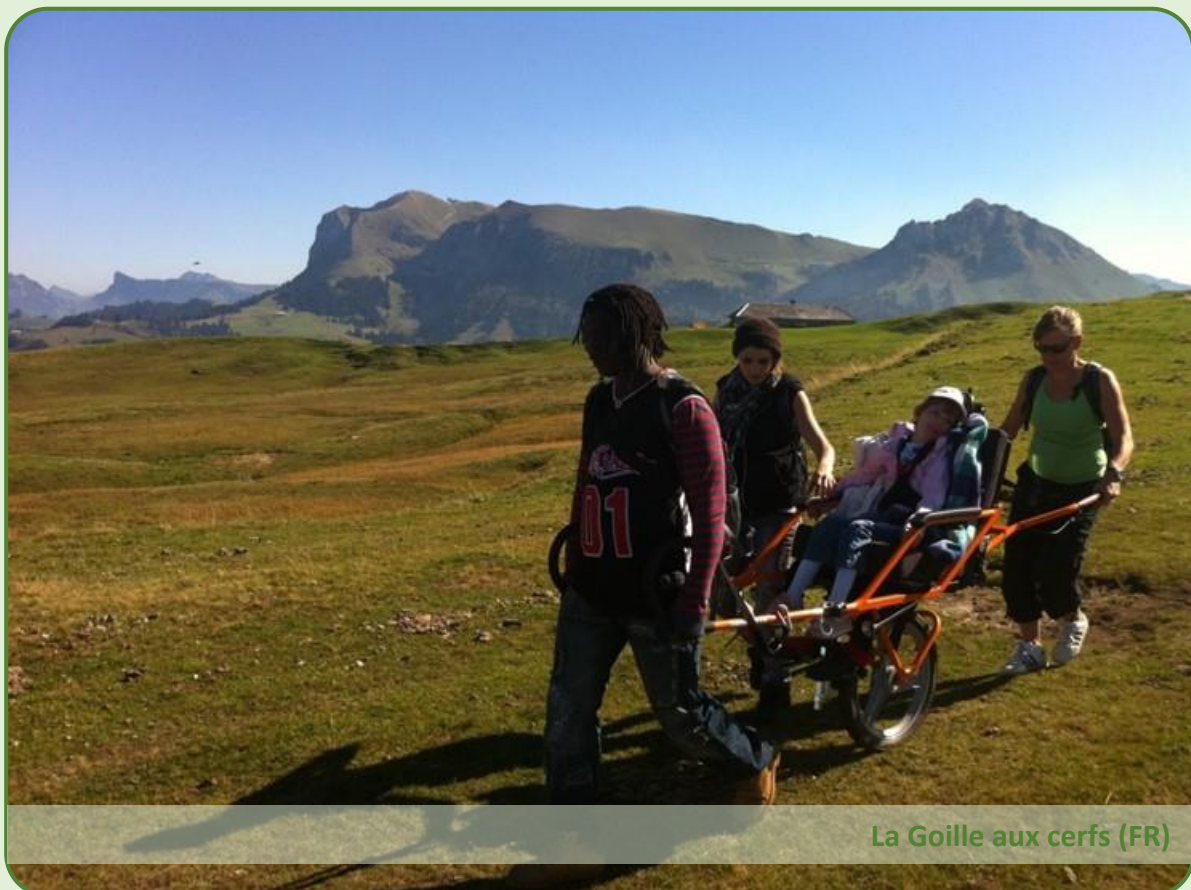
La Goille aux cerfs (FR)

L'objectif principal des membres de l'association reste le même : " Rendre la montagne accessible à tous ", tout en favorisant une rencontre riche et authentique entre les participants. Pour cela, l'association se dote des moyens nécessaires pour acquérir du matériel, reconnaître de nouveaux sentiers adaptés et promouvoir son activité.